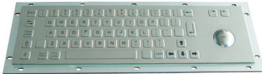
Abbildung US / Web-Layout, Seite 2: Beispiele DE und US Layouts