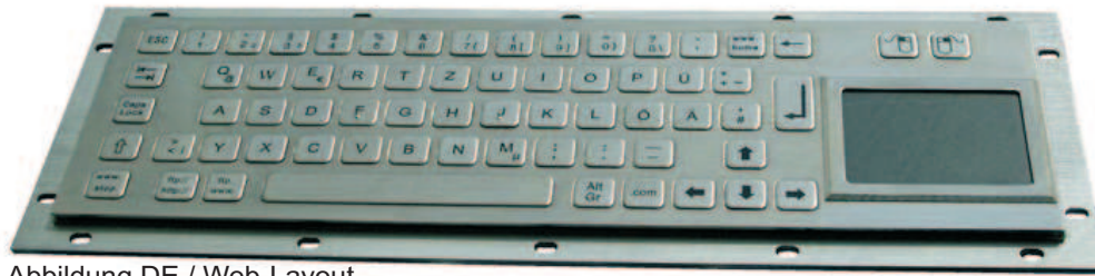
Abbildung DE / Web-Layout, Seite 2: Abbildungen DE und US Layout