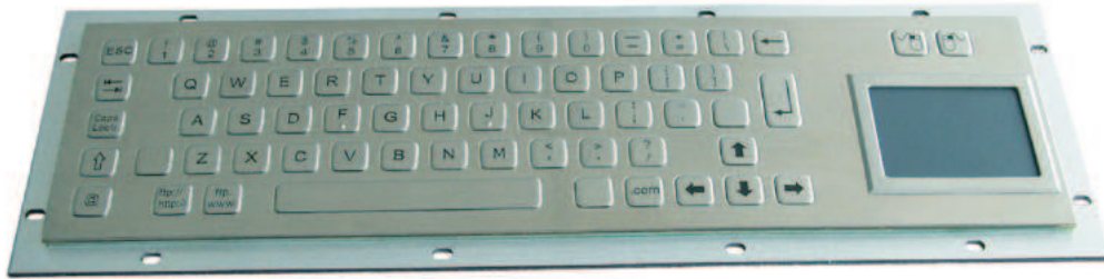
Abbildung US / Web-Layout, Seite 2: Abbildungen DE und US Layout