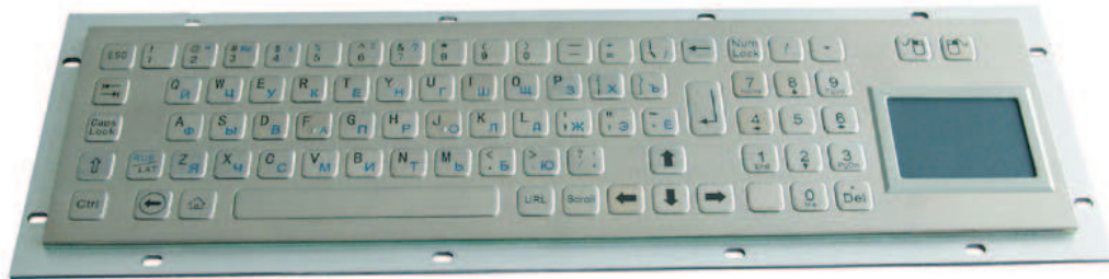
Abbildung Russisch / Web-Layout, Seite 2: Abbildungen DE und US Layouts